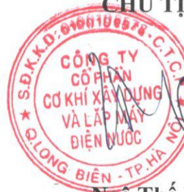
Ngô Thế Viên